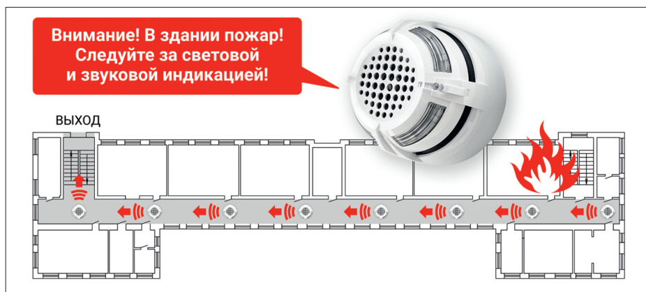
Рис. 3. "Нить Ариадны" – светозвуковая дорожка к выходу для управления эвакуацией при пожаре

Это решение особенно актуально для гостиниц. В случае пожарной тревоги жильцы покидают номера и попадают в длинный коридор. Светозвуковая дорожка помогает сориентироваться, в какой стороне находится выход.