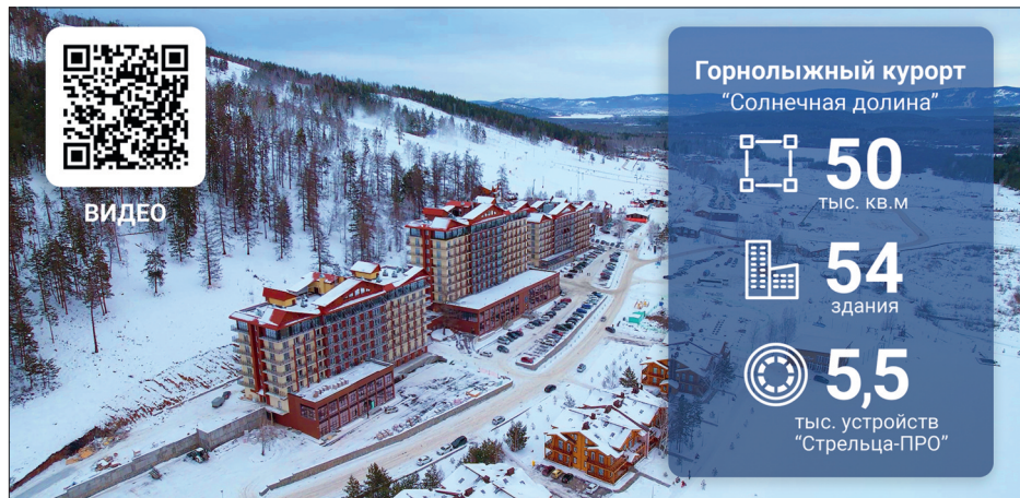
Рис. 1. "Стрелец-ПРО" защищает курорт "Солнечная долина"

За безопасность горнолыжного курорта Челябинской области "Солнечная долина" отвечает производимая компанией "АРГУС-СПЕКТР" беспроводная система "Стрелец-ПРО". 5,5 тыс. радиоканальных устройств защищают от пожаров 54 здания комплекса общей площадью более 50 тыс. кв. м.