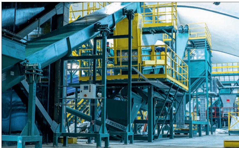
Рис. 1. Крупнейший завод по переработке пластика под защитой "Стрельца"

В 2023 г. в Твери открылся самый крупный в России завод по переработке вторичных полимеров – TotalCycle, входит в ГК EcoPartners. Мощность нового предприятия – 40 тыс. тонн сырья в год. Это уникальное производственное и образовательное пространство площадью 48 тыс. кв. м, включающее в себя завод по рециклингу пластиковой упаковки, музей, лекторий, ремесленную мастерскую и лабораторию. За безопасность инновационного комплекса отвечает беспроводная система "Стрелец-ПРО"