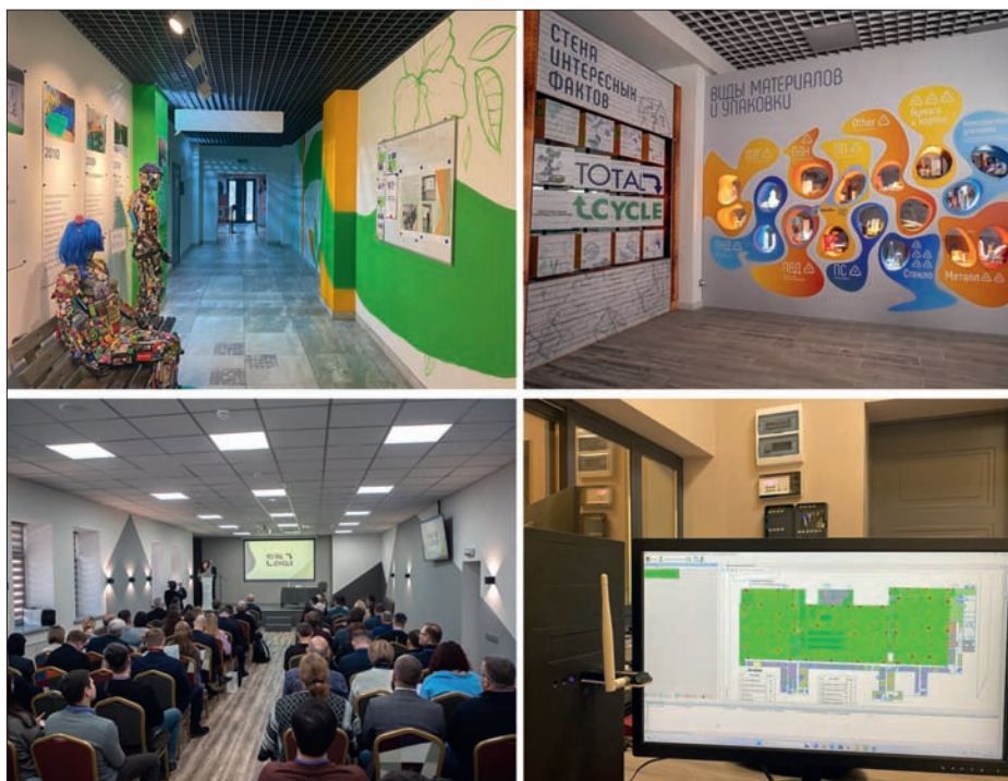
Рис. 2. Пространство TotalCycle: музей, лекторий, пост охраны

ли, а на монтаж и пусконаладку – один месяц. В монтажной бригаде постоянно работали пять человек – один инженер и четыре монтажника.