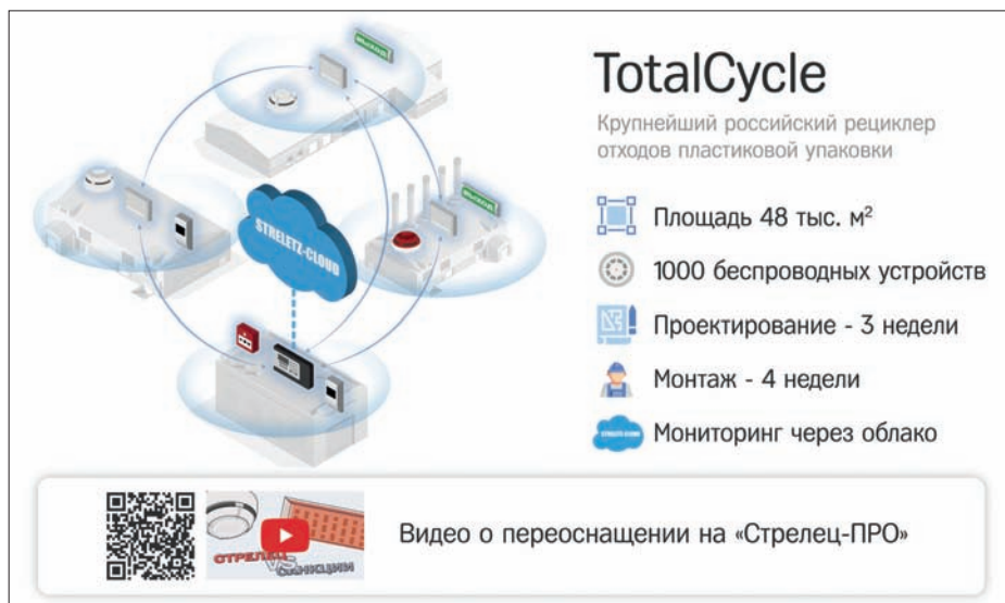
Рис. 3. "Стрелец-ПРО" в разы упрощает каждый этап работ, от проектирования до обслуживания

Наряду с новым заводом TotalCycle обеспечивать пожарную безопасность оборудованию компании "АРГУС-СПЕКТР" уже доверяют множество крупных промышленных предприятий страны, в том числе заводы "БИАКСПЛЕН", "Сибур-Химпром", завод базальтового волокна "Basfiber – Каменный век", Уралмашзавод, Краснокамский ремонтно-механический завод, "Норильскникельремонт", "Транснефть – Приволга", Южно-Приобское месторождение. Высочайший уровень надежности, удобство установки и обслуживания делают радиосистему "Стрелец-ПРО" идеальным решением как для оснащения новых объектов, так и переоснащения действующих.