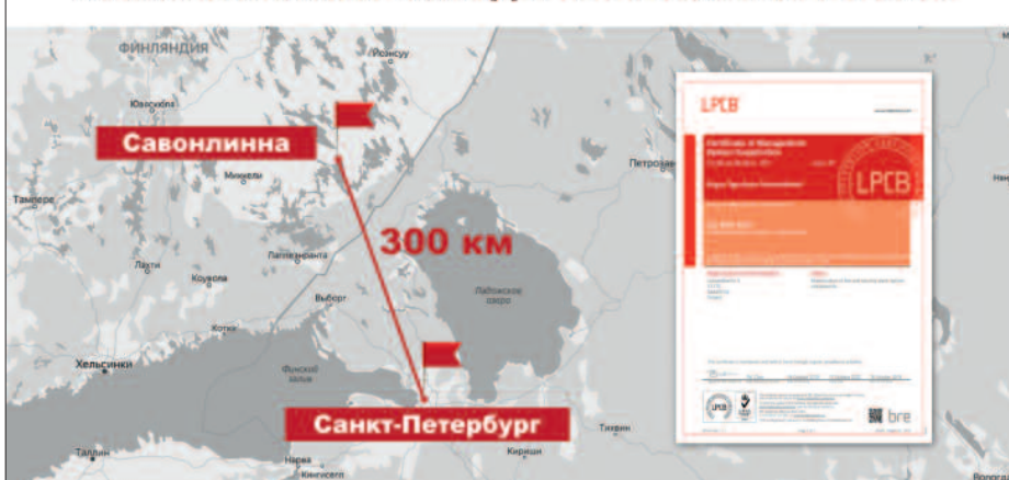
Сертификация на соответствие ISO9001:2015 в LPCB/BRE Global

Парламент Великобритании (Биг-Бен), резиденция королевы в Шотландии, Королевский театр Бельгии, университеты Кембридж и Итон, аэропорт Франкфурт-на-Майне, Цирк Дю Солей, станция "Восток" в Антарктиде, Эрмитаж и Третьяковская галерея – все эти объекты защищает от пожаров оборудование российской компании "Аргус-Спектр", которое теперь будет производиться и в Финляндии. Наличие двух заводов на расстоянии 300 км друг от друга – в России и Финляндии – обеспечивает высокий уровень надежности компании и гарантирует своевременность поставок оборудования клиентам.