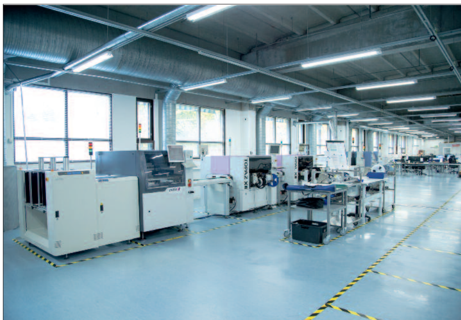
Завод "Аргус-Спектр" в Финляндии

Новое высокотехнологичное предприятие в Савонлинне – это пример взаимовыгодного сотрудничества двух стран: для Финляндии – значительные инвестиции в развитие промышленности, а для российского предприятия – расширение экспортного направления и увеличение объемов выпускаемой на экспорт продукции на 50 млн евро в год.