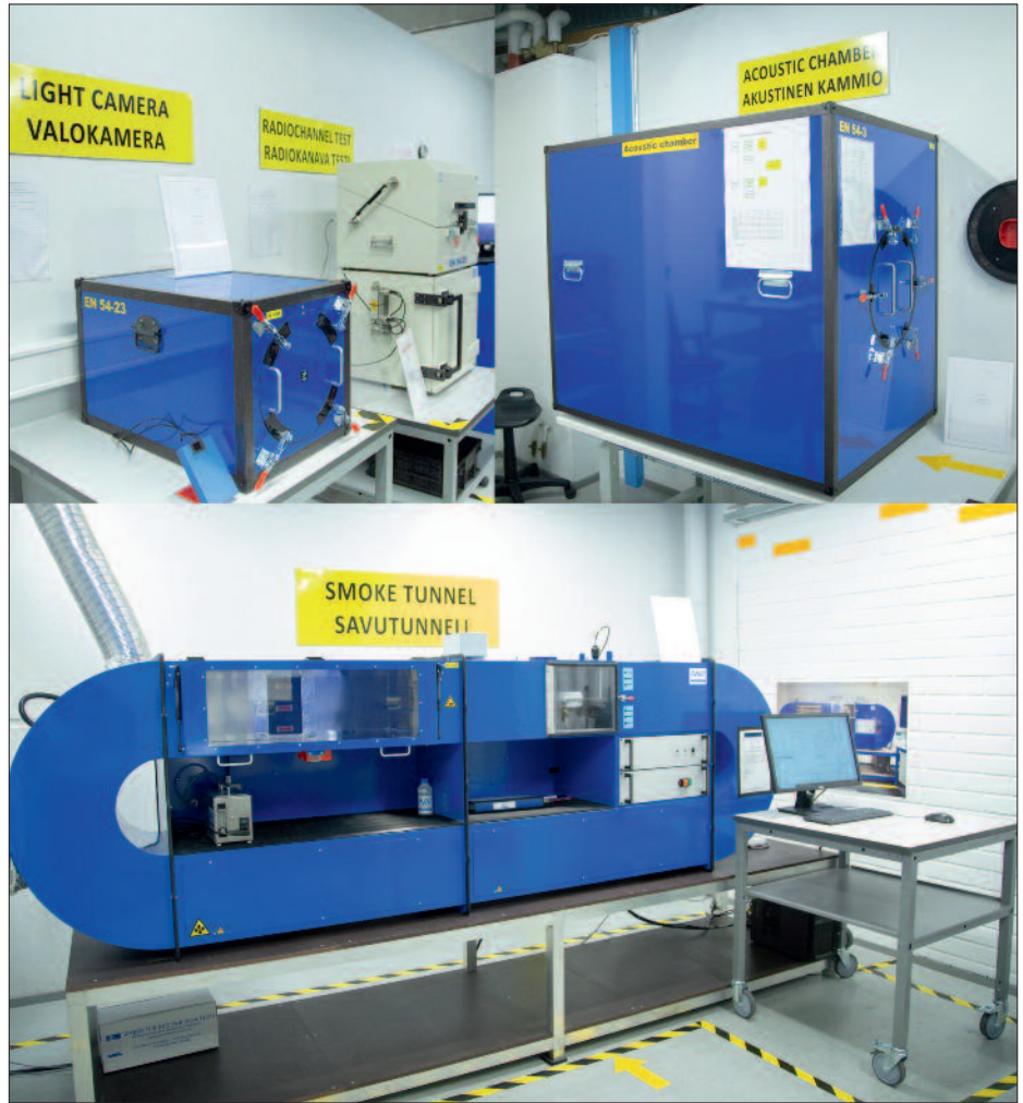
Испытательная лаборатория "Аргус-Спектр" в Финляндии соответствует требованиям EN54

Компания "Аргус-Спектр" заключила контракт с самым престижным сертификационным центром LPCB/BRE Global (Великобритания) на сертификацию продукции, которая будет производиться в Финляндии.