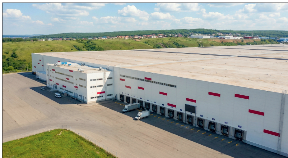
Рис. 1. Склад Wildberries в Новосемейкино Самарской области

Высокие потолки, километры стеллажей, металлоконструкции – таковы реалии складского комплекса Wildberries в Самарской области. Здесь, где скорость, гибкость и абсолютная надежность систем являются ключевыми факторами, выбор был сделан в пользу радиоканального решения "Стрелец-ПРО". Эта передовая беспроводная система безопасности обеспечивает безупречную защиту, полностью соответствующую всем нормативам, и гарантирует минимальные сроки монтажа и запуска пожарной автоматики, идеально подходя для столь масштабного объекта.