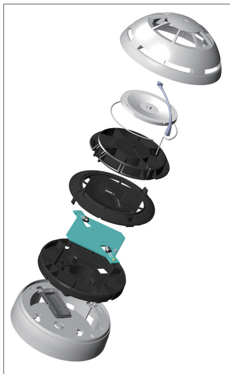
Рис. 1. Конструктивные элементы ИПДОТ российского производителя

В неадресных СПС выявление места ложного срабатывания – весьма трудозатратный про-